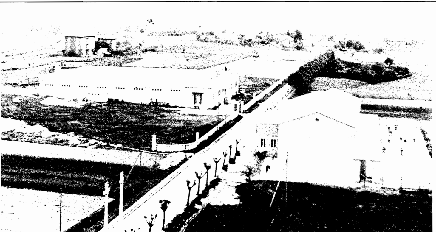
il cinema e l'oratorio (1951)